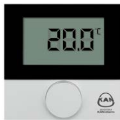
Standartinis šildymo termostatas su LCD 230V / 24V