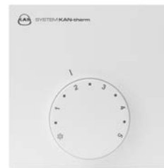
Analoginis šildymo / šaldymo termostatas 230V / 24V