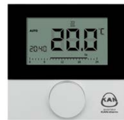
Šildymo / šaldymo termostatas su LCD 230V / 24V