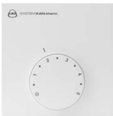
Analoginis šildymo termostatas 230V / 24V